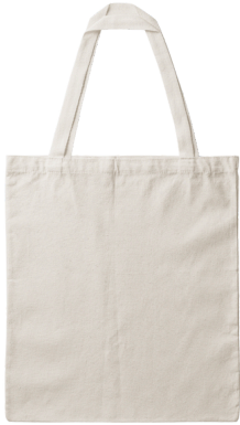
Bolsa de Manta