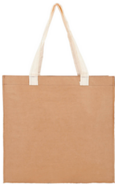
Bolsa de Cartón